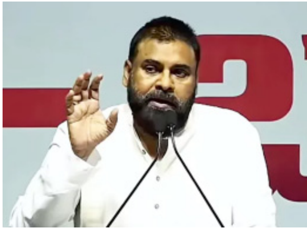
చేయాలి" అని పవన్ పేర్కొన్నారు.

మంగళగిరి: యువతకు సరైన వేదికగా మారాలనే పార్టీ పెట్టినట్లు ఏపీ డిప్యూటీ సీఎం పవన్ కల్యాణ్ తెలిపారు. కొత్త పంథాను నమ్ముకొని అనేకమంది యువత నక్సల్స్లో చేరారని, సిద్ధాంతాలను వదలేక వేలాది మంది చనిపోయారని అన్నారు. ఐడియాలజీ సరైనది కాకపోతే అనేక ఇబ్బందులు వస్తాయన్నారు. మంగళగిరిలోని సీకే కన్వెన్షన్లో జనసేన నిర్వహించిన 'పదవి-బాధ్యత' సమావేశంలో పవన్ మాట్లాడారు. ఎన్నికల్లో ఓడిపోయినా పార్టీ కోసం బలంగా నిలబడారని అందుకే మీ అందరికీ పదవులు వచ్చాయన్నారు. అందరూ కలిస్తేనే సమాజం తయారైందని తెలుసుకోవాలన్నారు. "కూర్చోబెట్టి ఊకదంపుడు ఉపన్యాసాలు చేయడం వృధా. ప్రతి వంద కిలోమీటర్లకు మన భాష, అలవాట్లు, ఆచారాలు మారిపోతున్నాయి. పర్యావరణాన్ని పరిరక్షించేందుకు అనేక చర్యలు చేపడుతున్నాం. దురాశతో పర్యావరణానికి తీవ్రంగా నష్టం చేస్తున్నాం. పర్యావరణాన్ని పరిరక్షించే అభివృద్ధి జరగాలని కోరుతున్నాం. మనం ఏం పని చేసినా రాజ్యాంగానికి లోబడే పని చేయాలి" అని పవన్ పేర్కొన్నారు.