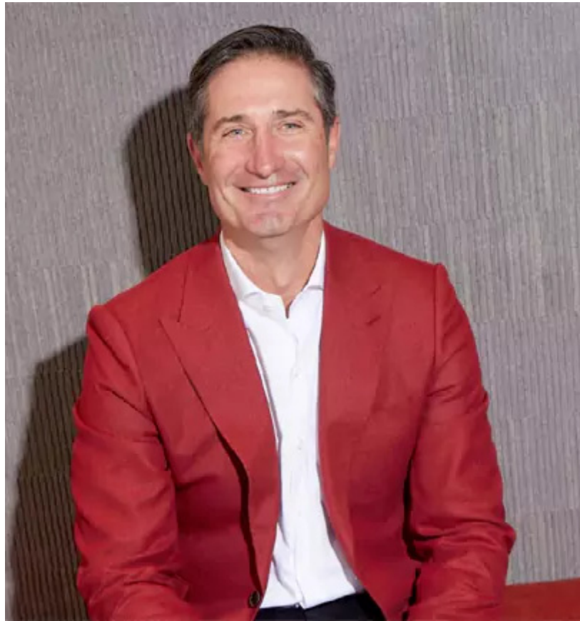
వాటాలు, ఆయన ప్రయాణానికి జెట్ కూడా ఇవ్వనున్నారు. ఇలాంటి ప్రయాణ ఒప్పందం గతంలో ఆయన 2018లో విఫలమైంది. స్టార్బక్స్ సీయోబిఓ సెంటర్లోని కోల్ ప్రధాన కార్యాలయం ఉంటుంది. ఆయన

మనం ఉద్యోగాల కోసం నిత్యం పొరుగు ఊళ్లకు వెళ్లేవారిని చూస్తుంటాం.. ఏ వంద కిలోమీటర్ల అయితే రోజువారీ రాకపోకలు చేస్తారు. అంతకుమించితే చాలామంది ఆయా ఊళ్లలోనే ఉండేందుకు ఇష్టపడతారు. కానీ, అమెరికా కాఫీ దిగ్గజం స్టార్బక్స్ నూతన సీఈవో బ్రియాన్ నికోల్ మాత్రం తన ఇంటి నుంచి 1,600 కిలోమీటర్ల దూరంలోని కార్పొరేట్ ఆఫీస్ కు రాకపోకలు సాగించాలని నిర్ణయించుకొన్నారు. ఇందుకోసం కార్పొరేట్ జెట్ కూడా సిద్ధమైతే అధికారిక లేఖ తెలియజేసాడు.